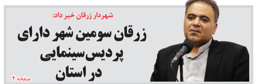
شهردار زرقان خبر داد: زرقان سومین شهر دارای پردیس سینمایی در استان